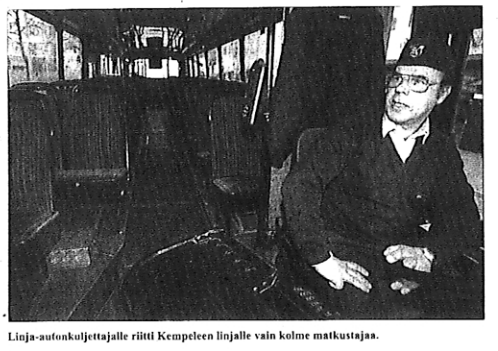
Linja-autonkuljettajalle riitti Kempeleen linjalta vain kolme matkustajaa.

asarin poikkakadulla. Suomi on ykkönen - Suomi on maailman-mestari, Suomi! "We are the champions!" huu-taa kaveri toisen reppuslästä. Lippu ja pyöräillä lähestyvät: "Hyvä Suomi! Osooooo..." Ne olivatkin illan eniten kuulut sa-nat taputusten siivittäminä.