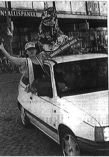
Kiekkollan voitto synnytti itsestään kansanjuhlan Oulun keskustaan. Lūput, ikulauheet, tyy-täys sekä läsnäollinen ja itsetuntoinen ohivat päällimmiten myöhään yöhön.