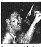
Suomen lippu kelpasi poseeraukseen, hattuun, hartiille, ja vielä käteen liehumaan.